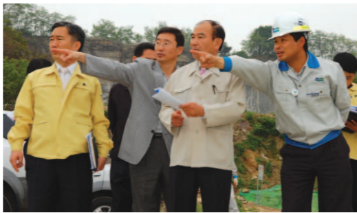
▲ 관내 현장점검 및 보도순찰

이를 위해 먼우금 사거리 일대를 ‘간판이 아름다운 시범거리’로 조성하여 걷고 싶은 거