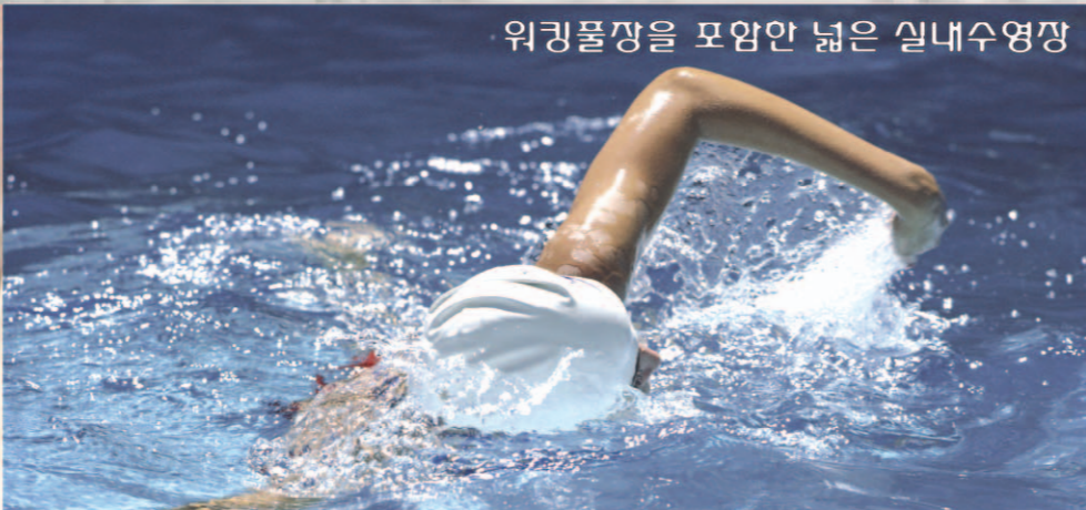
워킹몰장을 포함한 넓은 실내수영장