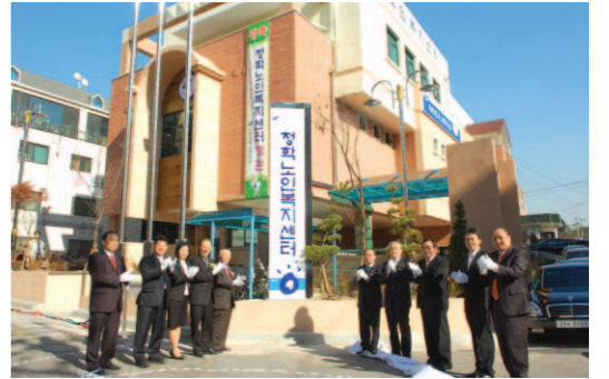
▲ 연수구 청학노인복지센터 개관 기념식

개인서비스요금 등 지역물가를 안정적으로 관리하고, 점차 심화되고 있는 우리 사회의 양극화 현상을 해소하기 위하여 취업정보센터 운영을 통한 고용촉진으로 일자리 창출을 위해 최선을 다할 계획이며, 상가 밀집지역을 중심으로 이벤트 사업을 적극 발굴 추진토록 하