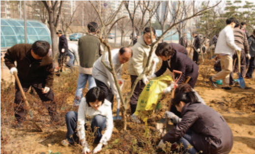
▲ 유희지 내 유실수 심기 사업 추진

또한, 2014년 아시안게임 유치와 관련해 새로 확충되는 체육시설이 연수구 관내에 설치될 수 있도록 최선의 노력을 다할 방침이다.