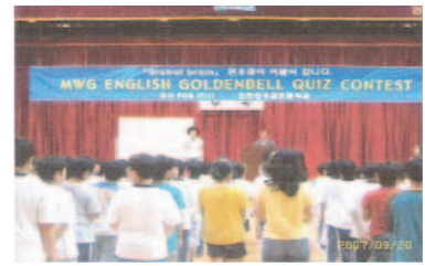
5학년 영어 골든벨 퀴즈콘테스트