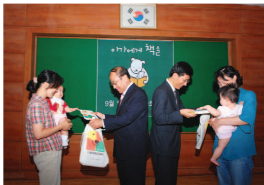
▲ 연수구 북스타트 3주년 기념행사

현재 연수구에는 인천지하철1호선연장공사, 수인선복선전철공사, 인천대교로부터 제2경인고속도로간 연결도로공사 등의 대규모 공사가 진행 중에 있으며 구에서는 이러한 대규모 사업들이 원활하게 진행될 수 있도록 행정적 지원을 아끼지 않을 것이며, 공사과정에서 발생되는 민원에 대해서는 주민들의 의견을 폭넓게 수렴해 적극 반영될 수 있도록 최선의 노력을 다할 방침이다.