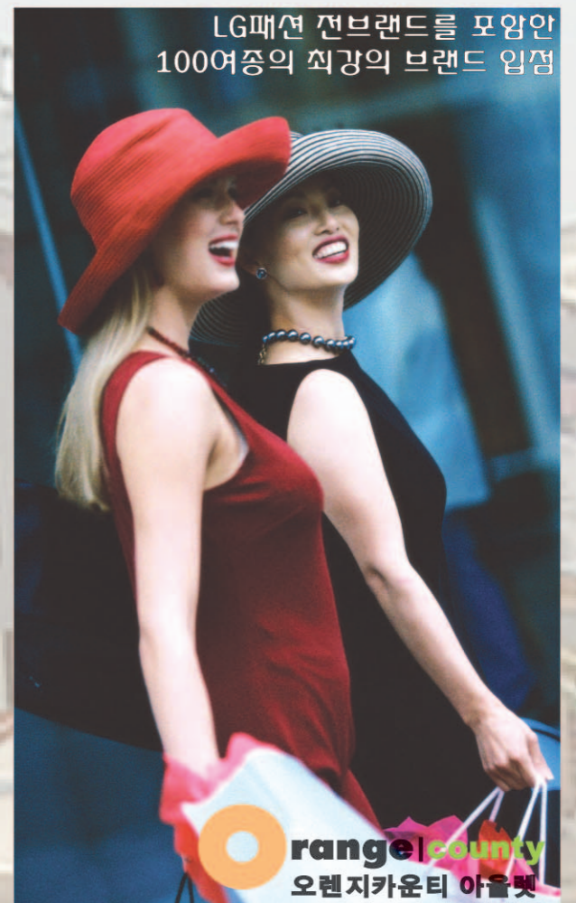
LG패션 전브랜드를 포함한 100여종의 직강의 브랜드 입점