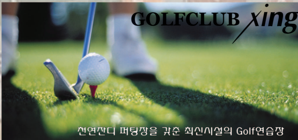
현연잔디 퍼팅장을 갖춘 최신시설의 Golf연습장