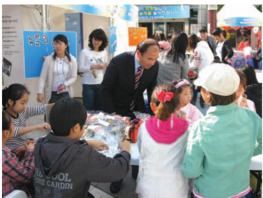
▲ 제6회 인천평생학습 축제에서

연수구는 2008년도 무자년(戊子年) 새해를 맞이해 ‘미래의 도시 희망의 연수’ 건설을 더욱 앞당기기 위해 ‘최고의 교육환경 조성 및 평생학습 지원체계 구축’ ‘주민들의 다양한 문화욕구를 충족할 수 있는 문화예술·체육도시 조성’ ‘국제도시에 걸맞은 친환경 도시경관 조성’ ‘편리하고 안전한 정주환경 조성’ ‘활기차고 역동적인 지역경제 활성화’ ‘나눔과 돌봄이 함께하는 따뜻한 복지도시 조성’ 등 6대 분야를 중심으로 전 행정력을 집중할 계획이다.