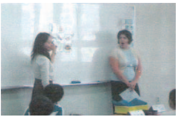
원어민 선생님과 영어수업 모습

교육청 학교평가 우수학교, 인천광역시교육청 교육과정 우수학교 및 교육인적자원부 100대 교육과정 공모에서 종합부분 우수학교 표창을 받았다.