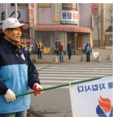
거리질서 캠페인 모습