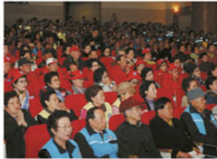
연수구 사회복지과 ☎810-7298

이날 행사에 참석한 연구구청장은 “오늘 노인일자리사업 발대식을 계기로 참여 어르신들의 자긍심 고취는 물론 근무의욕을 제고하는 뜻 깊은 자리가 되길 바란다”며 “앞으로 다양한 노인일자리 창출을 통해 고령화 사회에 나타나는 노인문제를 해소하고 노인복지증진은 물론 지역사회발전에도 기여할 수 있도록 최선의 노력을 다하겠다”고 말했다.