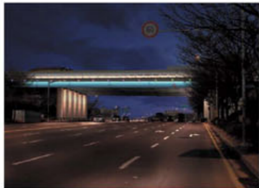
▲ 경원로 야간경관

릉로 및 만우금길 일대에 조경식재, 수경시설(도수로 및 분수대), 야간경관조명, 미관블럭 등을 설치해 관내 상권 밀집지역의 경제 활성화에 기여할 것으로 기대되며 '간판이 아름다운거리 조성사업'과 함께 만우금사거리를 중심으로 명실상부한 연수구의 명품거리로 자리매김하게 될 것이다.