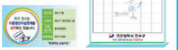
[식품생산자실명제 스티커] [식품생산자실명제 표지판]

○ 즉석판매제조·가공업 소내 또는 생산제품포장지에 아래 식품생산자 실명제에 의한 표지판 및 스티커 부착 여부 확인후 제품 구입