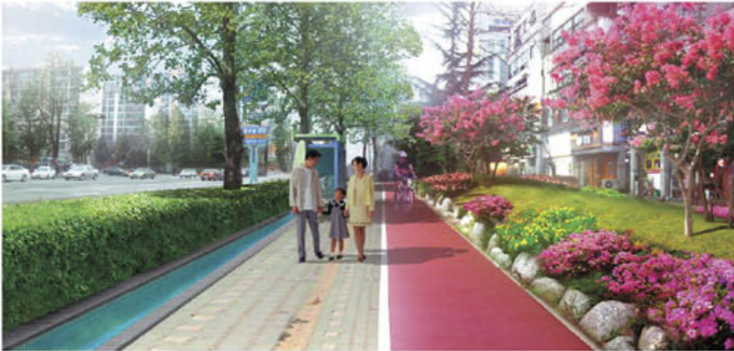
▲ 특화거리 조경식재

연수구가 다양한 도시경관 조성사업을 통해 아름다운 도시 이미지로 새롭게 변모하고 있다.