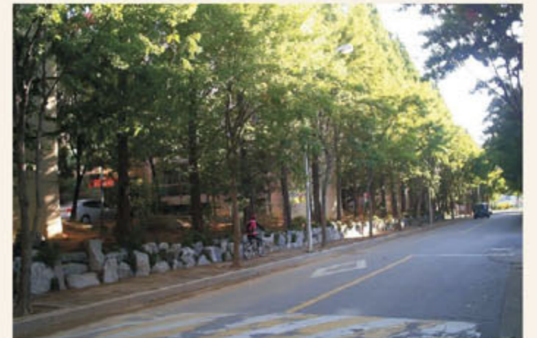
▲ 동춘동 건영아파트

연수구는 그동안 공공부문에 치중해 온 '담장 허물고 나무심기'사업을 단독주택과 아파트단지 등 민간부문에 대한 지원으로 확대 추진하고 있다.