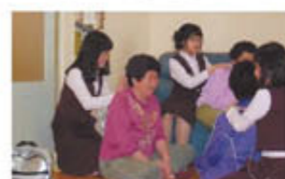
명예기자 · 임기자

이밖에도 청학중학교는 순수한 마음으로 효행 활동도 하고 있는데, 1교 1노인정 결연 사업을 지속적으로 구체적으로 실천해 학생들에게 참다운 효의 뜻을 이해하고