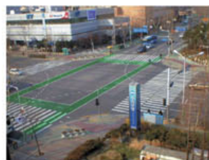
▲ 교차식 구간

자전거전용도로 조성은 새로운 국가전략으로 추진하는 저탄소 녹색성장 사회실현을 위한 특색 사업으로 보다 안전한 자전거이용 인프라를 구축하고 교통수단으로서 자전거의 입지를 확고히 하여 범국민 자전거타기 붐을 조성하고 에너지를 절약하는 친환경정책사업으로 앞으로 지역주민들이 자전거이용의 일상화를 위해 관내 자전거도로 및 편의시설을 지속적으로 확충하여 연수구가 자전거 이용이 가장 편리한 도시로 발돋움 할 수 있도록 최선을 다할 것이다.