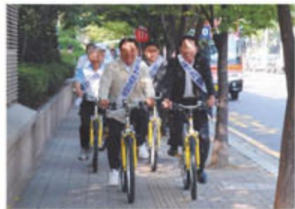
▲ 업무용 자전거 시험 운영

간은 총연장 12km(양방향 24km)로 앵고개길(3.4km), 원인재길(3.3km), 능허대길(0.7km), 먼우금길(2.4km), 연수길(1.1km), 미추홀길(0.9km), 함박외길(0.2km)이며 도로폭 1.5m의 자전거전용도로는 차선폭을 줄이거나 기존 도로의 1개 차로를 없애는 도로다이어트 방식이 적용된다.