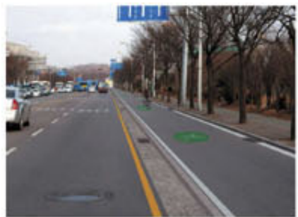
▲ 단차 분리식 구간

역별 노선별 세부 설치계획으로 먼저 1공구는 총연장 6.7km(양방향 13.4km) 규모로 앵고개길(단차식, 화단구간), 원인재길(단차식)에 총 27억원의 사업비가 투입되며 2공구는 총연장 5.3km(양방향 10.6km) 규모에 능허대길(단차식), 먼우금길(단차식, 화단구간), 함박외길(기존보도를 이용한 자전거·보행자겸용도로)로 총 20억원의 사업비를 들여 자전거 전용도로가 조성된다.