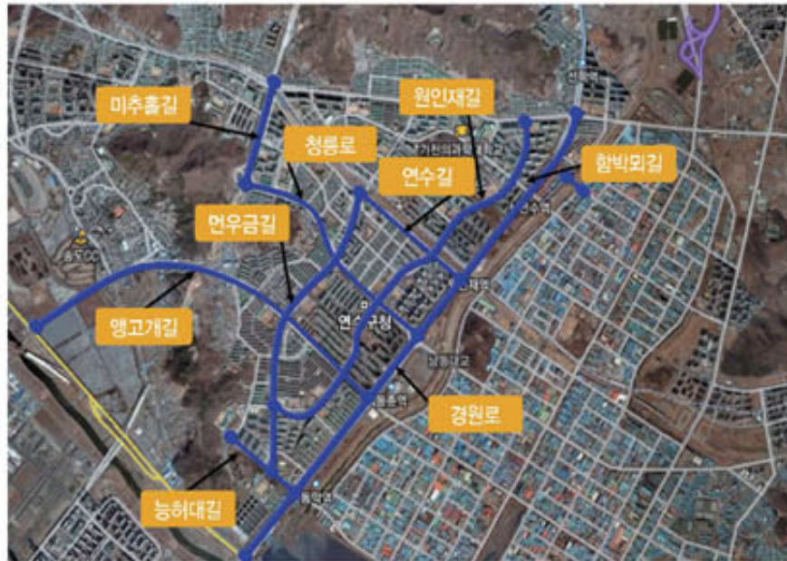
▲ 자전거 도로 위치도

우리는 친환경 교통수단인 자전거이용 활성화 정책의 일환으로 관내 주간선도로변에 권역별 자전거전용도로를 새롭게 조성한다.