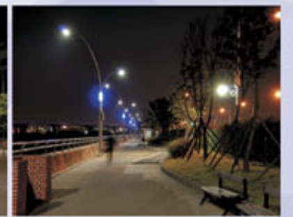
▲ 아암로 해양공원 경관조명 조성사업