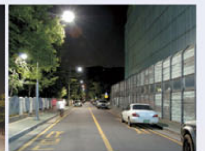
▲ 배수지길 가로등 정비사업