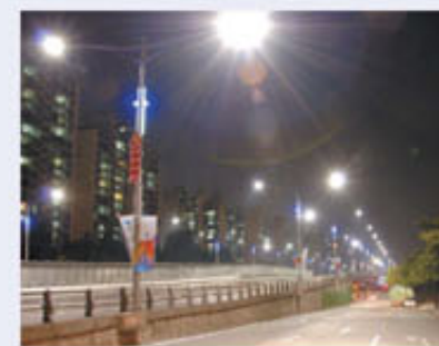
▲ 105호 고가교 경관조명 조성사업