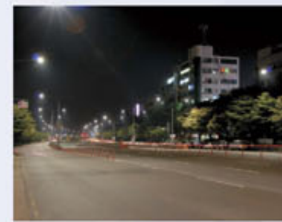
▲ 선학역 일원 가로등 정비사업