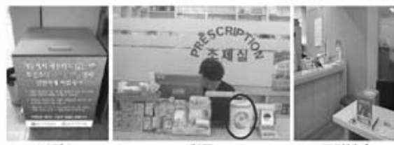
보건소 약국 주민센터