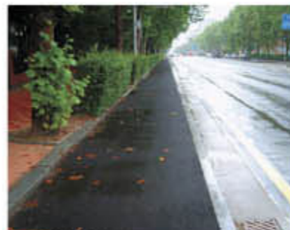
▲ 단차식 현경사진