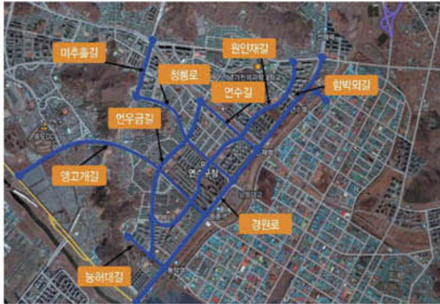
▲ 자전거도로 개념

인천광역시에서는 '저탄소 녹색 성장'의 가치 아래 자전거 전용도로를 설치하고자 1단계 사업으로 종양간선본부, 남동구, 연수구에서 시청권역, 남동권역, 연수권역 자전거 전용도로 설치공사를 시행하고 있습니다.