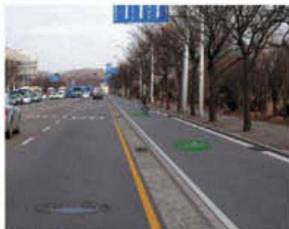
▲ 단차식 조경도