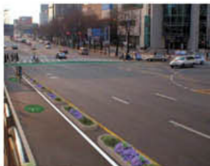
▲ 화단식 조경도

새로운 국가전략으로 추진하는 사업으로 편안하고 안전한 자전거도로가 조성될 수 있도록 적극 노력하겠으니 불편하시더라도 양해하여 주시기 바랍니다.