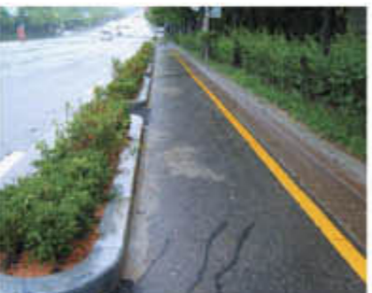
▲ 화단식 현경사진