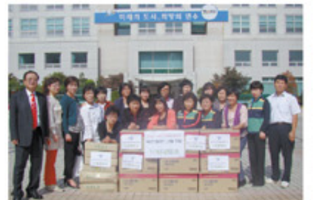
연수구 자치행정과 ☎ 810-7103

한 새터민들에게 선물을 구입하여 전달함으로써 추석 명절을 따뜻하게 보내고 훈훈한 이웃의 정을 느끼도록 하고자 마련된 것이다. 통·리장연합회 연수구지부 관계자는 “앞으로도 어렵고 소외된 이웃을 위한 다양한 봉사활동을 지속적으로 펼쳐 나가겠다”고 말했다.