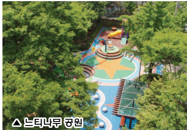
△ 느티나무 공원